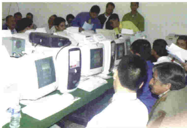
Aspecto de la Segunda Insaculación realizada en los Consejos Distritales Electorales

que contribuyeron de forma muy eficaz a dar al funcionario de casilla mayor confianza y seguridad en el desempeño de sus funciones.