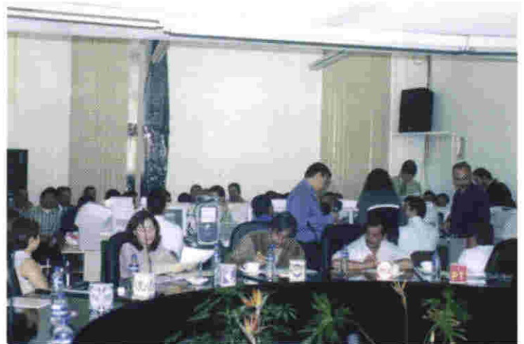
Por primera vez el IEEZ realizó con sus propios recursos el proceso de insaculación

Si con la letra que se le indicó al sistema - en este caso la "z" - no se completara el 20%, o no hubiera 50 ciudadanos insaculados, el sistema tomaría automáticamente la letra siguiente, y se repetiría el proceso hasta completar el número requerido de ciudadanos.